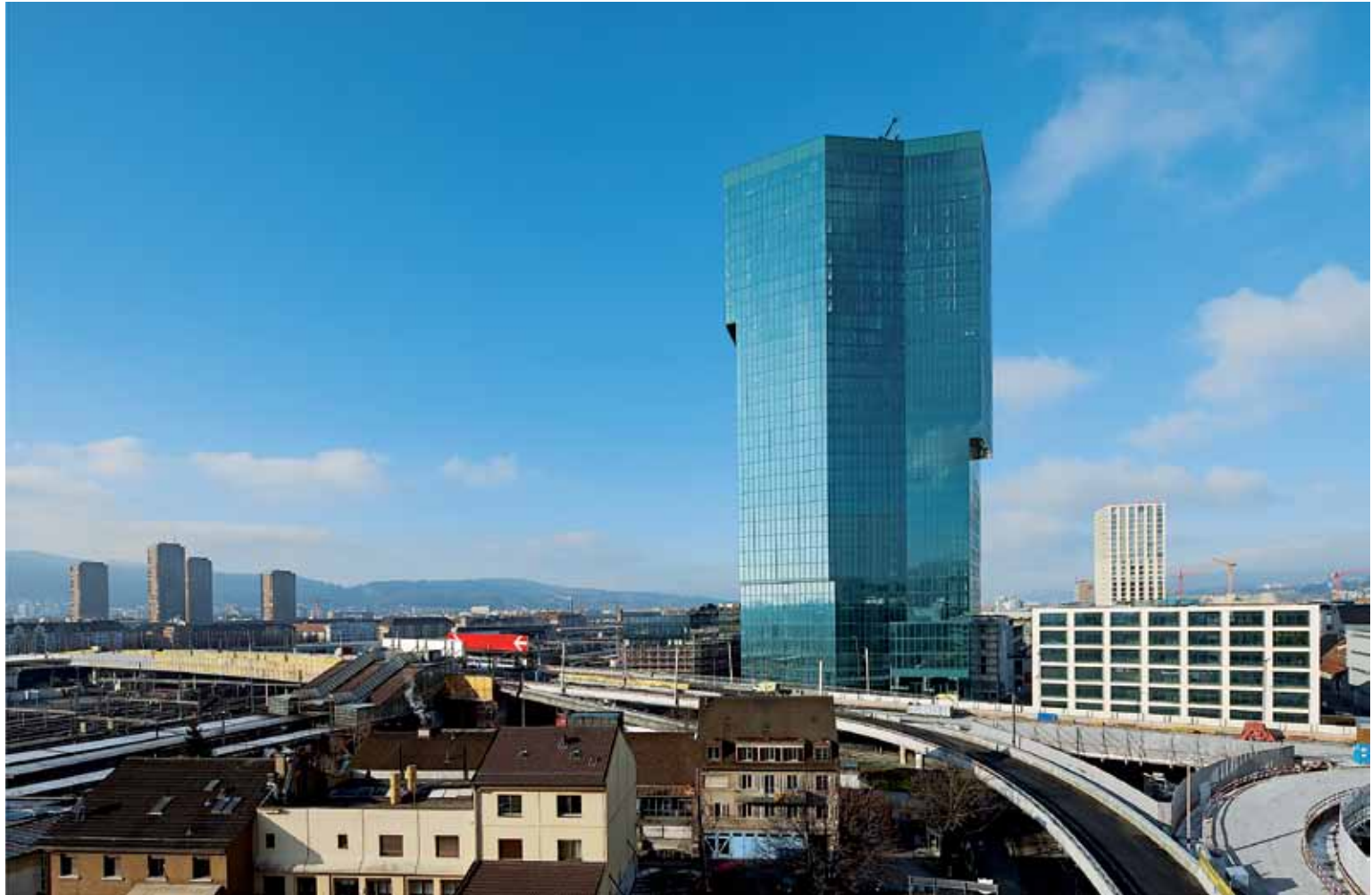
Der Prime Tower in Zürich