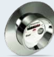
UPZ +m MK Kapselzähler System MK