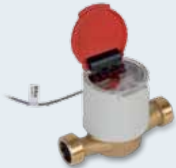
UNICocoder® Einstrahl Wasserzähler