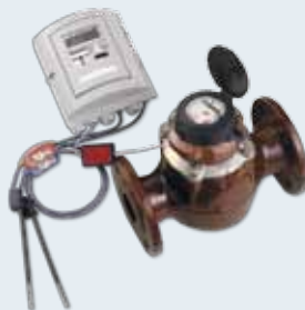
EnerCal F3 Wärmehzähler