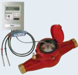
EnerCal F2 Wärmehzähler