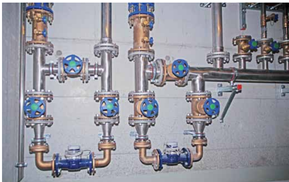
Kaltwasserzähler DN 50

Im Sanitärbereich wurden ebenfalls über 200 GWF-Wasserzähler von der Firma Benz + Cie AG, Zürich verbaut. Diese mehrheitlich mit der GWFcoder®-Technologie versehenen Wasserzähler können ebenfalls über M-Bus zentral ausgelesen werden und liefern die Verbrauchsdaten zu Abrechnungszwecken.