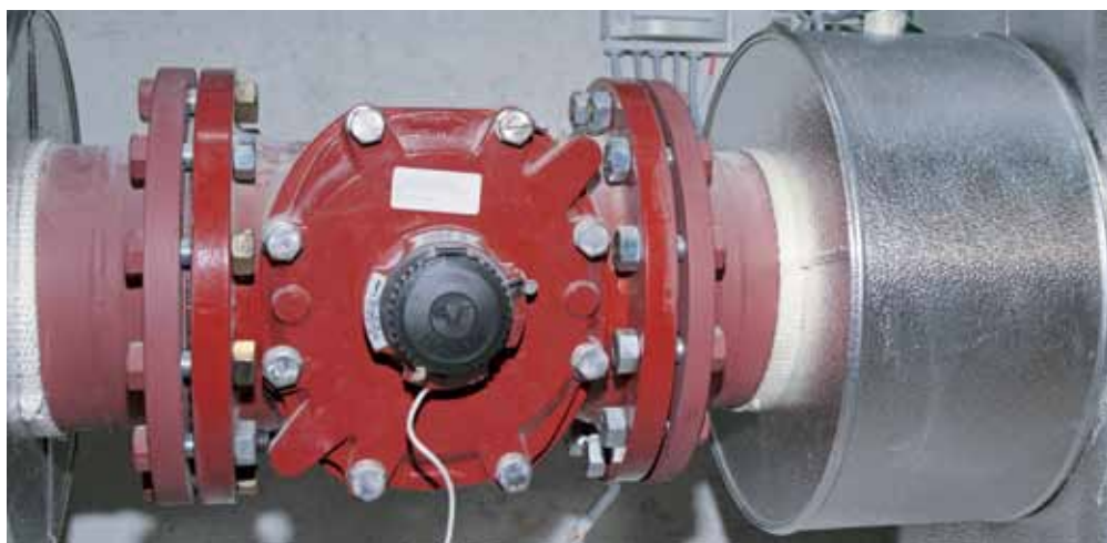
Wärmezähler Wärmepumpe Quantum DN 200 für 176 m 3 /h