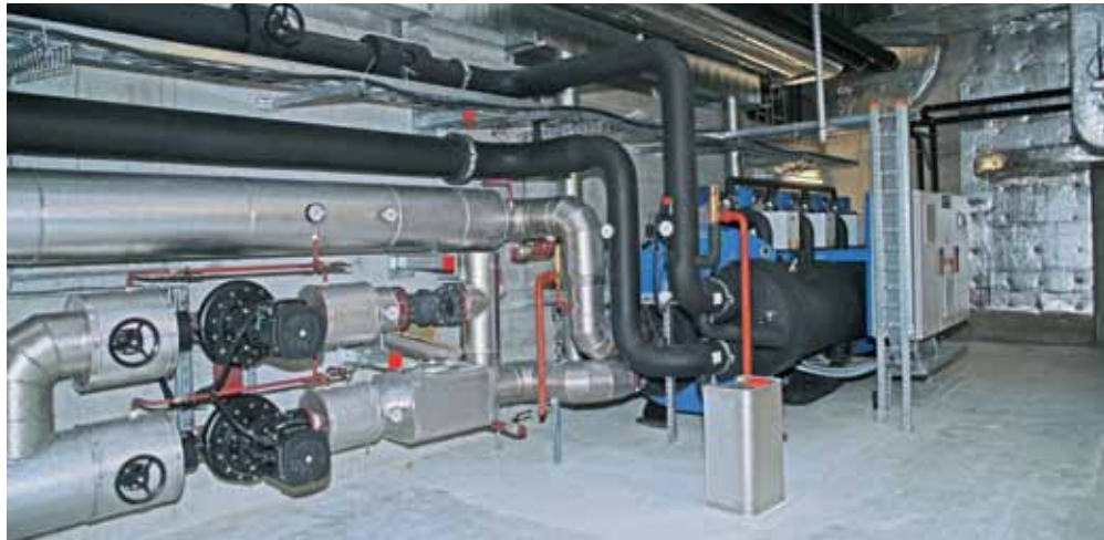
Energiezentrale 2. UG