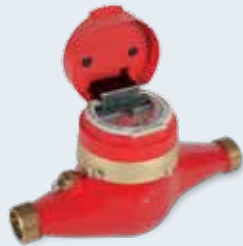
MTWcoder® Mehrstrahl Wasserzähler