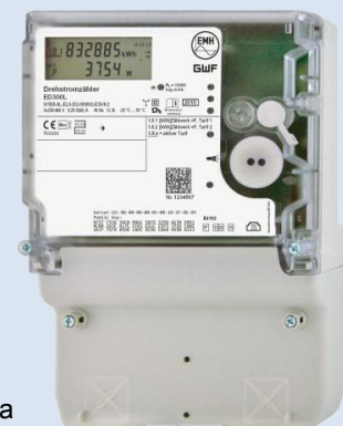
Smart Meter

La terminologie concernant le Smart-Metering est clarifiée ci-dessous [2]. En anglais, le terme AM (Advanced Meter) est employé pour les instruments de mesure avec communication intégré pour le télérelevé. Sur cette base, nous appelons AMR (Advanced Meter Reading) les compteurs de la première génération, pouvant être relevés périodiquement à proximité, et AMI (Advanced Meter Infrastructure) ceux de la deuxième génération, qui fonctionnent dans un réseau fixe et automatique. Nous parlons d'une communication unidirectionnelle lorsque le compteur ne peut qu'envoyer les données, et de communication bidirectionnelle, si les données et les commandes peuvent être envoyées et reçues. Dans le premier cas les données sont envoyées au distributeur; dans le deuxième cas, le distributeur peut désactiver des appareils gros consommateurs, modifier un modèle de tarif ou effectuer des mises à jour de logiciels. Le terme de Smart Metering est généralement utilisé pour un système bidirectionnel, pouvant transférer des données et des commandes d'un appareil de mesure vers un distributeur et dans la direction opposée. Le transfert des données peut se faire par câble ou sans fils.